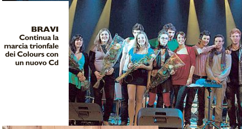
BRAVI Continua la marcia trionfale dei Colours con un nuovo Cd