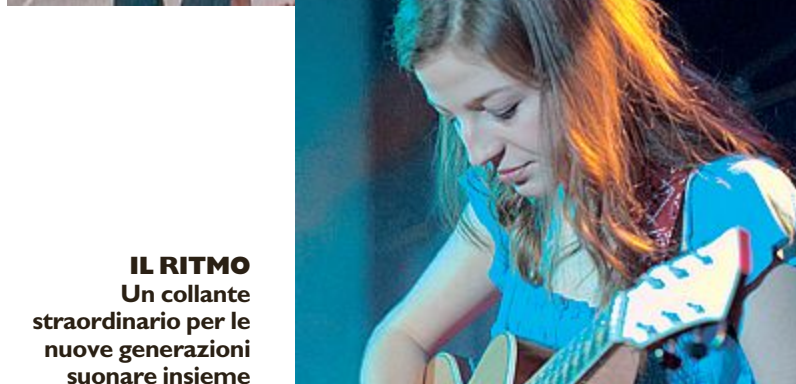
IL RITMO Un collante straordinario per le nuove generazioni suonare insieme