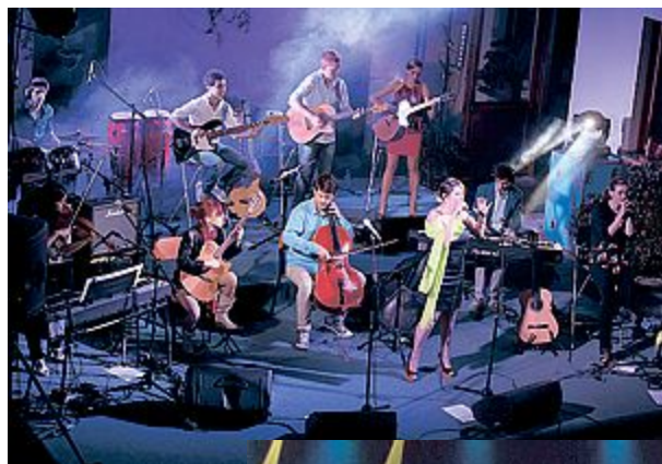
INSIEME Giovani musicisti con un sound accattivante